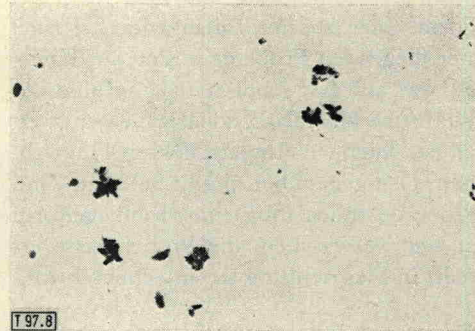
Abb. 8. Aufgefangene Blei-Partikeln. Vergrößerung 400 : 1.

Abb. 9a zeigt Röntgenblitzaufnahmen einer Probe aus Zinn; zum Vergleich sind in Bild 9b die entsprechenden Aufnahmen bei Verwendung von Comp. B als Sprengstoff (Bild 6) nochmals wiedergegeben. Sowohl in der äußeren Form als auch in der „Struktur“ der fliegenden Probe zeigen sich wesentliche Unterschiede. Im Gegensatz zur früheren Hohlkegelform (Abb. 9b) hat die Hauptmasse der Zinnprobe jetzt die Form einer flachen Schale. Außerdem ist die Probe deutlich in einzelne Bruchstücke unterteilt, während vorher (Abb. 9b) eine diffuse Massenverteilung mit verwaschenen Konturen auftrat. Insgesamt weist das Bild der Zinnprobe gerade diejenigen Merkmale auf, die in den Versuchen mit Comp. B als Sprengstoff bei den Proben aus Kupfer und Aluminium angetroffen wurden.